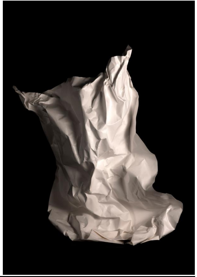
Seylan Kandak, Sculptures éphémères , Photo # 2, 2022 Seylan Kandak, Sculptures éphémères , Photo # 14, 2022